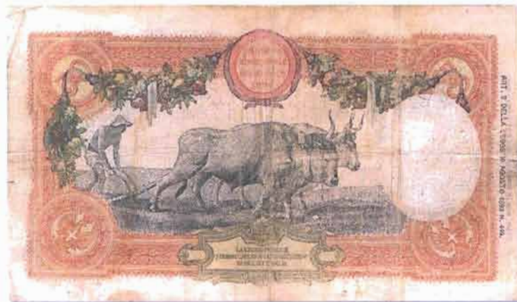
Un raro esemplare di banconota da 50 lire Buoi (mm 168 x 98)