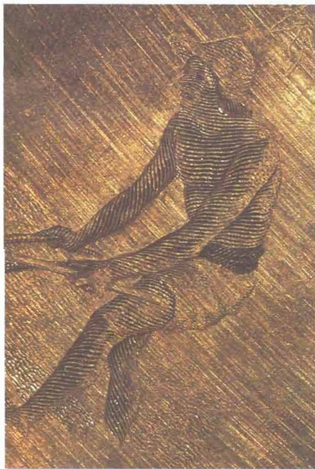
Dettagli del cliché originale per il verso delle 50 lire Buoi (dal volume Imprimatur , Electa per Banca d'Italia, Roma 1988)