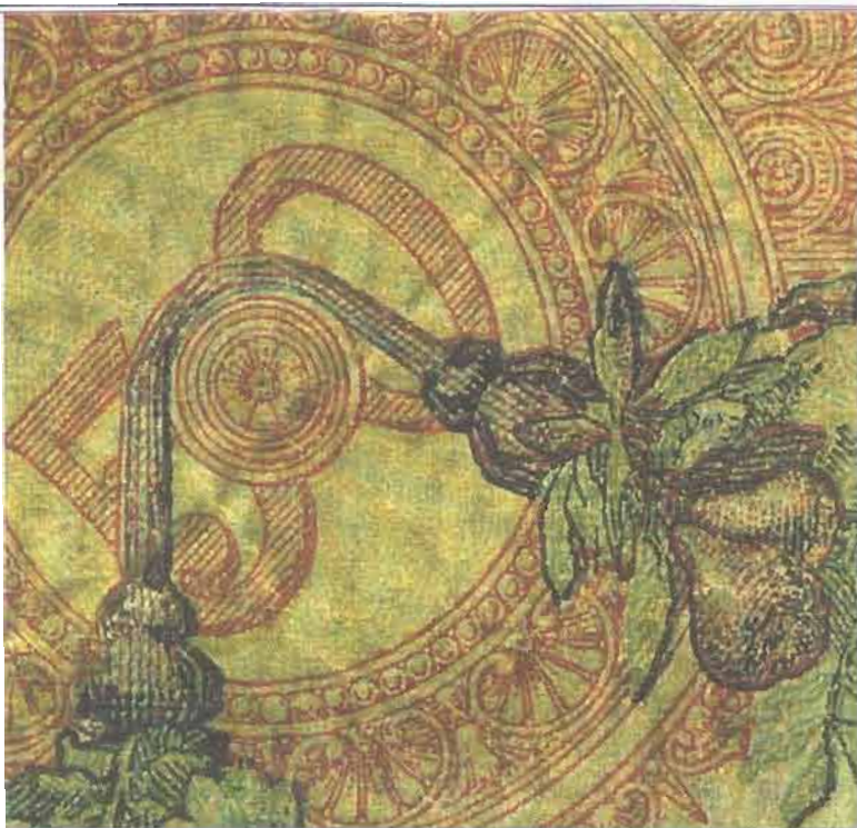
Dettaglio del valore e degli elementi decorativi delle 50 lire Buoi (dal volume Imprimatur , Electa per Banca d'Italia, Roma 1988)

zato di Pedara, arrivano i materiali più idonei per una falsificazione di qualità: acidi, colori in polvere, torchi tipografici, lastre di zinco, macchine fotografiche, risme di carta "made in Usa". Proprio l'uso di carta americana ci fa comprendere i saldi legami che esistono fra Cosa nostra, ovvero la mafia siciliana, e la Mano nera, un sistema di racket organizzato da immigrati italiani nelle più grosse metropoli statunitensi.